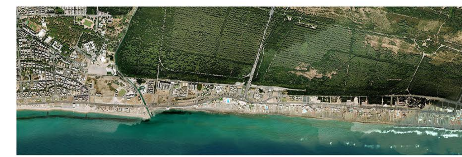
Elab. 11 Modello d'assetto per il lungomare di Ostia Zonizzazione con planivolumetrico e viste a volo d'uccello